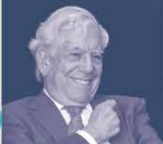
Mario Vargas Llosa por videoconferência