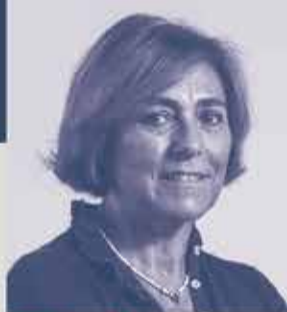
Maria do Rosário Pedreira