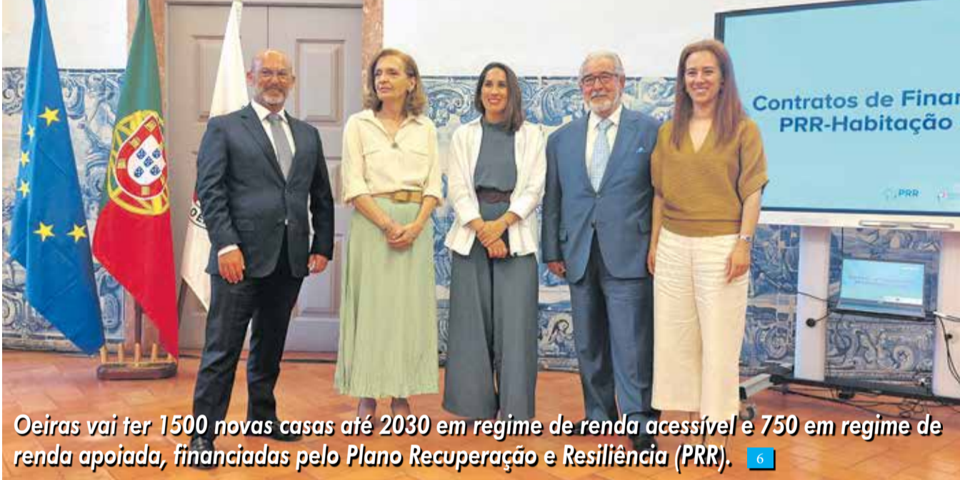
Oeiras vai ter 1500 novas casas até 2030 em regime de renda acessível e 750 em regime de renda apoiada, financiadas pelo Plano Recuperação e Resiliência (PRR). 6