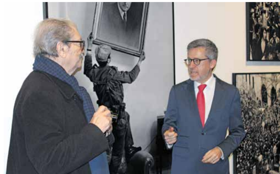
imagem do seu tempo histórico: de um homem que estava só, tal como só estava o seu regime”, frisou Moedas, recordando que Gageiro foi o autor da famosa fotografia de um soldado a retirar uma fotografia de Salazar na sede da PIDE, logo após a Revolução dos Cravos.

O autarca descreveu o repórter como um “fotógrafo que deu imagem e vida à história”. Uma destas imagens é, por exemplo, o retrato de António de Oliveira Salazar, no Forte de Santo António da Barra no Estoril. “Aquela foto não é um simples retrato de um homem. É também uma